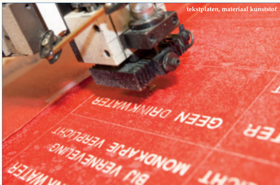
tekstplaten, materiaal kunststof

we merken dat er iets niet klopt – bijvoorbeeld in de tekst of uitvoering – dan trekken we meteen aan de bel. Samen proberen we tot het beste resultaat te komen. Dat merken klanten ook; dat je bereid bent een stap meer voor ze te zetten. Voorop staat het doel dat de klant tevreden is met het geleverde product.'